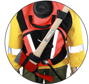
SOPORTE PARA HERRAMIENTAS