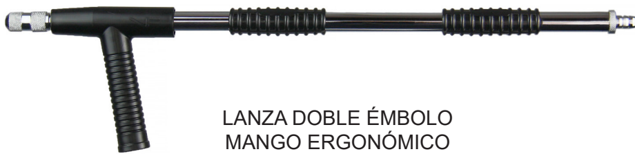
LANZA DOBLE ÉMBOLO MANGO ERGONÓMICO