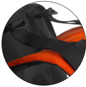
AJUSTE DE CARGA