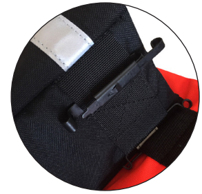
SISTEMA ALICE CLIP