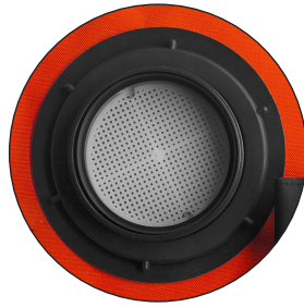
FILTRO DEL DEPÓSITO