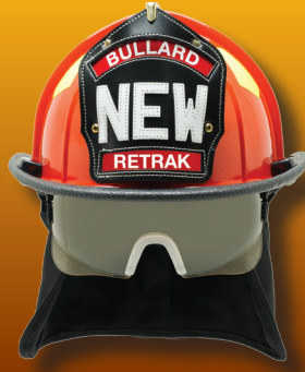
Pantalla ReTrak en posición de despliegue