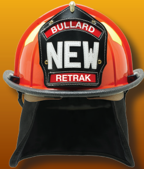
Pantalla ReTrak en posición de recogida