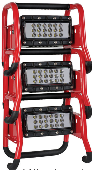
Apilable para formar una torre de luz

18 LEDs con reflectores que crean un haz difuso de grandes lúmenes